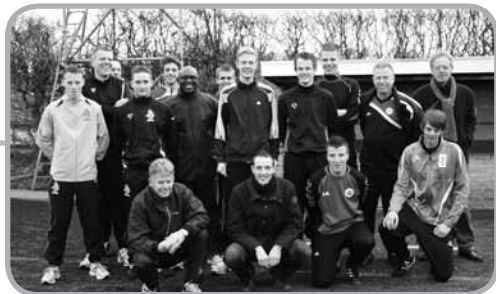
Trainende leden in april 2012