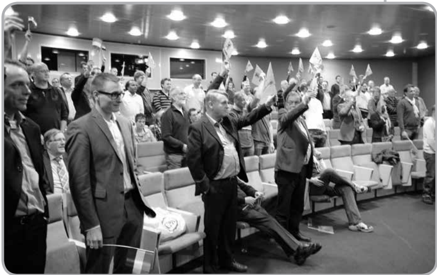
De zaal in actie tijdens de quiz: wel of geen buitenspel...