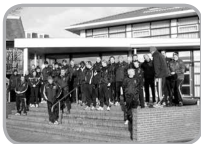
De deelnemers in januari 2012 bij de entree van Hotel Ameland.

De deelnemers zullen afreizen voor een weekeinde voor trainingen, spelregels en plezier. Kijk op www.covsgroningen.nl voor het volledige programma. Net als vorige keer zal er via de site live verslag worden gedaan in woord en beeld van de belevenissen op Ameland. Het weekeinde wordt gesponsord door sporthuis Winsum!