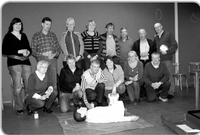
De deelnemers aan de training in februari 2012.

De training wordt gehouden in het GRC-clubhuis, van 19.30 – 22.30 uur. Deelname kost 15 euro en staat open voor leden, donateurs en relaties van de Scheidsrechtersvereniging en hun partners. Ken je dus familieleden, vrienden of collega's die mee willen doen? Nodig ze uit en schrijf ze in. Wil je meedoen? Stuur dan voor 24 januari 2013 een mail naar covsgroningen@gmail.com . Op de avond zelf kun je het verschuldigde bedrag voldoen.