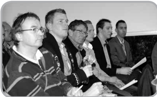
Aandachtig luisteren tijdens de jaarvergadering van 2012.

De Jaarlijkse Algemene Ledenvergadering is van begin maart verplaatst naar maandag 8 april. De vergadering begint om 20.00 uur. Redenen zijn agendatechnisch van aard en hebben te maken met andere afspraken en de beschikbaarheid van het GRC-clubhuis. Uiteraard voldoen we nog steeds aan de statutaire verplichting de vergadering binnen zes maanden na afsluiten van het boekjaar te houden. Noteer alvast de datum in je agenda.