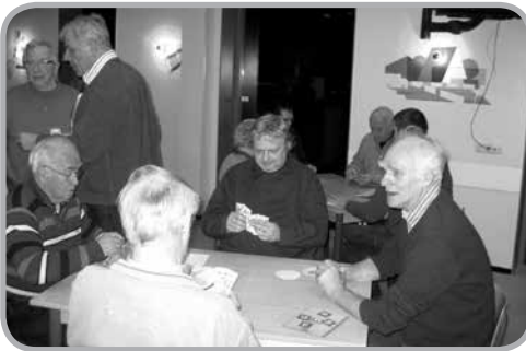
De jaarlijkse kaartavond in Ten Boer staat garant voor gezelligheid