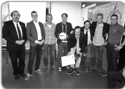
Forward nam met een ruime delegatie de fair play prijs in ontvangst