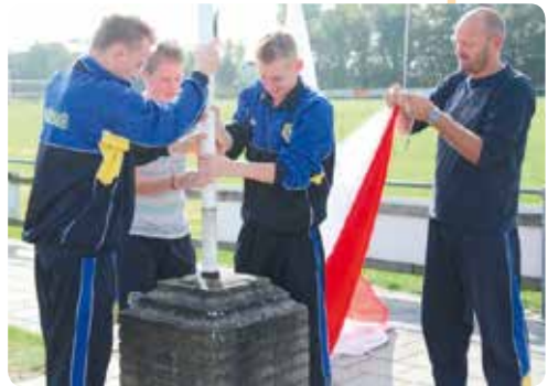
De Amelander scheidsrechters van Geel-Wit in actie met de vlaggenmast