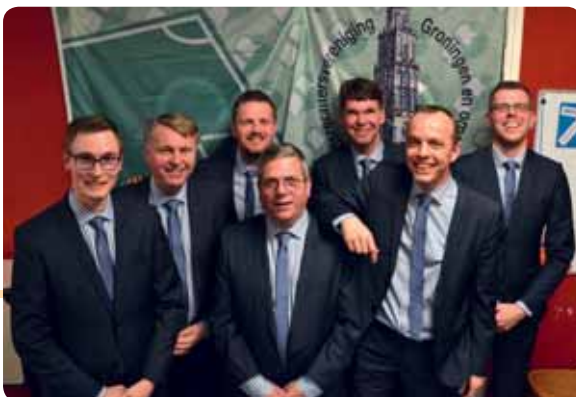
Het bestuur in maart 2015 bijeen