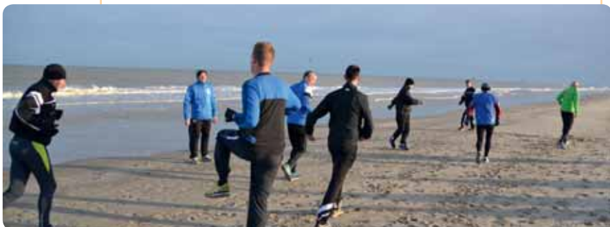
De perfecte trainingsomstandigheden