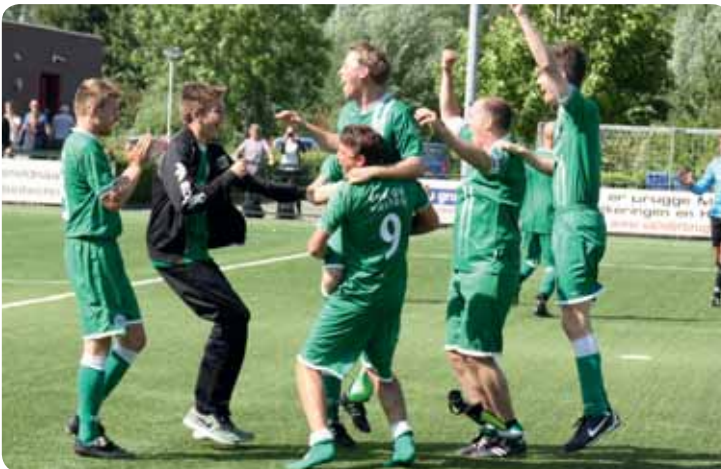
Dolle vreugde na de beslissende strafschop, REF United is Nederlands Kampioen

In januari al laten onze voetballers zien sportief te zijn, want ook op het NK zaalvoetbal op 17 januari veroveren we de fair play prijs. Verder dan een vijfde plaats in de zaal komen onze jongens echter niet.