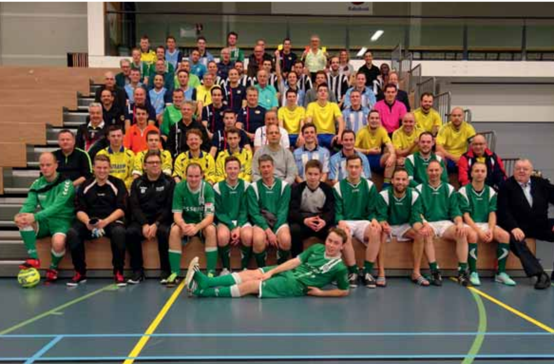
Alle deelnemers aan het NK zaalvoetbal

Scheidsrechtersvereniging Zeeuws-Vlaanderen was dit jaar de organiserende partij en er werd gespeeld in Terneuzen. Op een normale dag is dit vanaf Groningen bijna vier uur rijden. Het team koos er daarom voor om een dag eerder af te reizen richting Zeeland, zodat we fris aan de aftrap konden verschijnen. Er werd op vrijdagavond gepokerd en de sfeer zat er goed in. Na een gezamenlijk ontbijt op zaterdagmorgen was het nog een klein uurtje rijden naar Terneuzen. Onderweg kregen we het vervelende bericht dat onze eerste tegenstander (Boxmeer) een auto-ongeluk had gehad en onze eerste wedstrijd uitgesteld werd. Uiterst vervelend voor onze tegenstander en gelukkig was er alleen materiële schade. Bij aankomst konden we dus rustig aan doen, werd er nog even geklaverjast en uiteraard even gekeken bij de wedstrijd van onze andere tegenstanders.