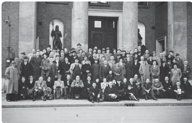
Een grote groep leden in 1958 bijeen, tijdens het 25-jarig bestaan, voor De Korenbeurs, vlak bij de plek waar de vereniging in 1933 werd opgericht.

85 jaar is geen officieel jubileum, dat vieren we weer bij het 90-jarig bestaan. Het is wel reden voor een bescheiden feestje. Op 8 maart zorgen we na de training voor een hapje en drankje. Ben jij er ook bij?