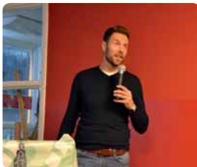
Pol van Boekel

De clubavond op 6 november met internationaal voetbalscheidsrechter Pol van Boekel kan als zeer geslaagd worden beschouwd. Bijna zestig aanwezigen krijgen van Pol een mooi inkijkje in zijn persoonlijke loopbaan, het reilen en zeilen van de videoreferee en het werken als vijfde/zesde official in Team Kuipers. Ook de headsetcommunicatie passeert de revue. Bovendien heeft Pol veel actueel beeldmateriaal meegenomen en durft hij zich kwetsbaar op te stellen. Als laatste tip geeft Pol het volgende mee: 'vergeet niet te genieten!'