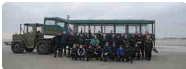
De Amelandgangers op de uiterste punt van het eiland