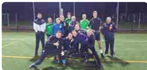
Vrolijkheid na een training in januari 2020

In totaal organiseren we 54 trainingen, tegenover 72 trainingen in het 'normale jaar' 2019. Op de dinsdag nemen er gemiddeld 14,11 leden deel (in 2019 12,96) en op donderdag maar liefst 21,79 (in 2019 is dit 18,53). Bert Kamstra geeft verreweg de meeste trainingen (35 keer). De overige trainingen worden gegeven door Henk Steenhuis (11), Freek Vandeursen (4), Marleen Drijfhout (2), Sam Dröge (1) en Wouter Wiersma (1).