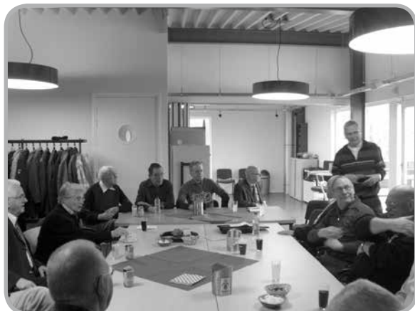
Een blik op de allereerste bijeenkomst van de seniorensoos, in 2011

Ook dit seizoen komt de seniorensoos elke tweede maandag van de maand van 14.00 – 1600 uur bijeen in het GRC-clubhuis. Voor een informele ontmoeting, een gezellig praatje en kopje koffie, een kaartje et cetera. Nog niet eerder geweest? Schuif dan snel eens aan. Het kan dit kalenderjaar nog op 11 november en 9 december.