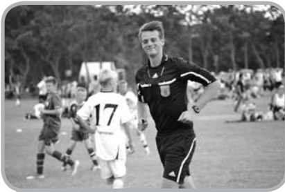
Mels in actie

Net als afgelopen jaren waren de weergoden de Dana Cup bijzonder goedgezind. Temperaturen overdag boven de 25 graden, geen drup regen gedurende de week en af en toe een verfrissend briesje. Ideale omstandigheden dus voor een paar daagjes strand voorafgaand aan het toernooi, en hier werd dan ook goed gebruik van gemaakt.