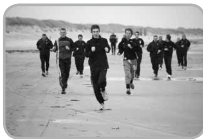
Trainer op Ameland: op het strand...

Hotel Ameland zal drie dagen fungeren als onze huiskamer en daarnaast zorgen voor een prima verblijf en ongetwijfeld voedzame en gezellige maaltijden. Deelname kost 175 euro per jaar en het is nog steeds mogelijk de resterende maanden tot het weekeinde hiervoor te sparen.