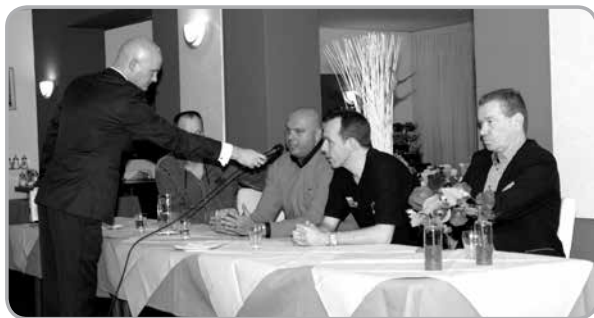
Op Ameland werd ook in een forumdiscussie stilgestaan bij het thema respect.