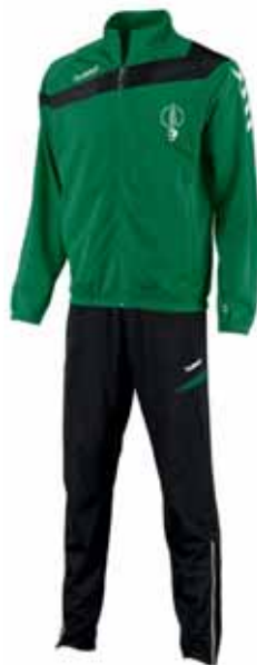
Ons eigen trainingspak