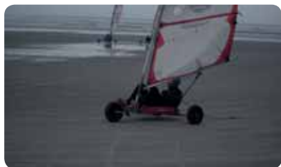
Strandzeilen was een spectaculair onderdeel van Sportweekend Ameland 2019.

De promotiegolf is ook dit jaar behoorlijk groot voor onze vereniging. Mooi om te zien dat er zo fantastisch wordt gepresteerd, ook door degenen