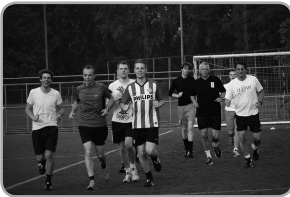
De eerste zomertraining van 5 juli in beeld.

De trainingen gaan met ingang van dit seizoen naar 20.00 uur. Op zowel de dinsdag als de donderdag kan mede daardoor gewoon op het kunstgras van sportpark Corpus den Hoorn worden getraind. Vanaf 11 september wordt ook de training op de dinsdag hervat. Overigens zijn de zomerse trainingen in juli en augustus zeer in de smaak gevallen, zo blijkt uit de hoge opkomst. Lees er meer over op pagina 5.