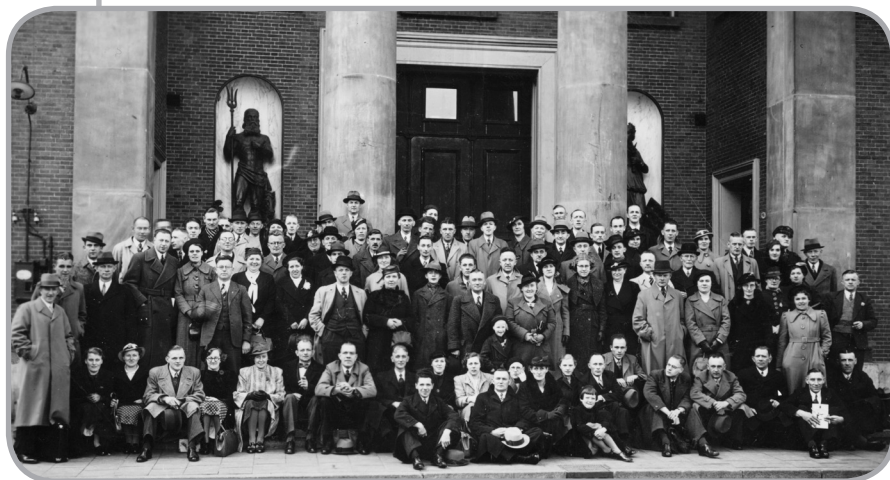
In 1958 werd het 25-jarig bestaan gevierd in de Korenbeurs op de Vismarkt.

Eén datum moet je zeker alvast noteren en dat is vrijdag 8 maart 2013. Die dag bestaat de Scheidsrechtersvereniging Groningen en Omstreken namelijk precies tachtig jaar. Een respectabele leeftijd voor onze jonge vereniging! En dus alle reden een bescheiden feestje te vieren... Over het hoe en wat informeren we je later.