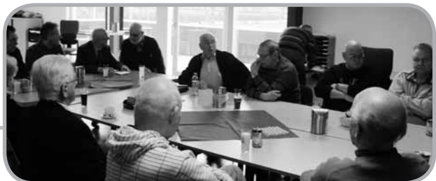
De seniorensoos is van start

Kortom, de seniorensoos heeft een prima start gemaakt en is daarmee een nieuwe vaste activiteit van de Scheidsrechtersvereniging Groningen en Omstreken. Ben je nog niet geweest, maar wil je wel aansluiten? Je bent van harte welkom! Ken je nog oud-leden die we zouden kunnen uitnodigen? Laat ons dat dan weten via covsgroningen@gmail.com .