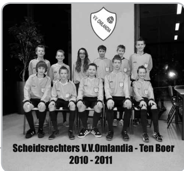
Scheidsrechters V.V.Omlandia - Ten Boer 2010 - 2011