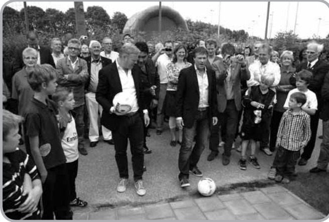
de Koemannen schieten het nieuwe clubhuis symbolisch open.

Al 21 jaar is onze vereniging thuis op sportpark Corpus den Hoorn. Dat wordt in 2011 nog eens duidelijk gemaakt door een bord met logo bij de entree van het sportpark te plaatsen. Bovendien krijgen we een reclamebord langs het hoofdveld van GRC.