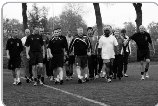
De trainingsgroep aan het werk.