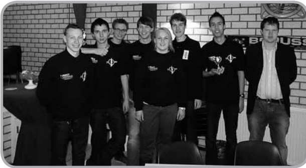
Onze spelregelteams bijeen.

Op spelregelgebied verzorgen we bijeenkomsten voor enkele voetbalverenigingen. Verder wordt er op de website veel aandacht aan spelregels geschonken. Zo kan er voor het eerst online worden deelgenomen aan het Johan Roeders spelregelkampioenschap.