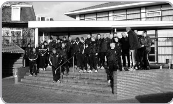
De deelnemers op de trap van hotel Ameland.

Terug naar de basis luidde het parool van het technisch weekeinde Ameland. En dat werkte, want het werd van 13 – 15 januari een groot succes. Het weer werkte mee, hotel Ameland bleek een voltreffer en het programma stond als een huis. Velen spraken van het leukste weekeinde in veertien jaar. Kijk op pagina 12 en verder voor een verslag en voor foto's.