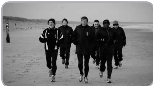
Ook in 2011 wordt er fanatiek getraind op Ameland.